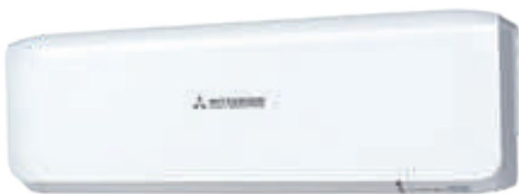
SRK-ZS-W, Wit RAL9003