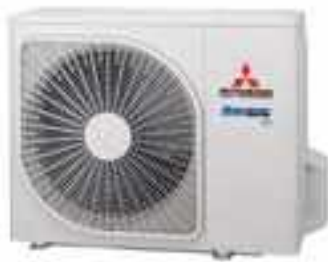
SRC20ZSX-W, SRC25ZSX-W, SRC35ZSX-W, SRC50ZSX-W, SRC60ZSX-W