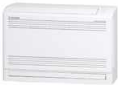
SRF25ZMX-S, SRF35ZMX-S, SRF50ZMX-S