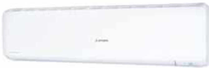
SRK63ZR-W, SRK71ZR-W, SRK80ZR-W