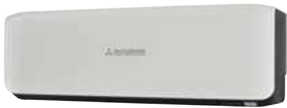
SRK-ZS-W(B), Contrast zwart-wit