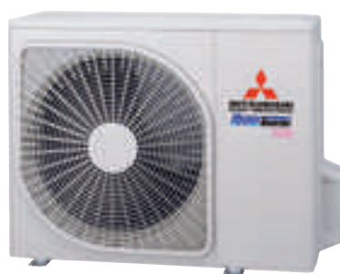
SRC40ZSX-W1, SRC50ZSX-W1, SRC60ZSX-W1