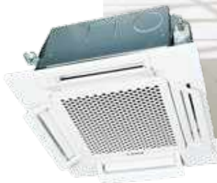
FDTC40VH, FDTC50VH, FDTC60VH