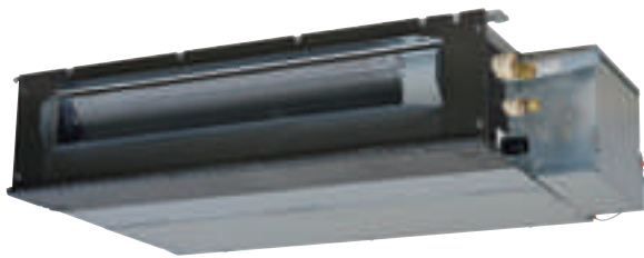
SRR25ZM-S, SRR35ZM-S, SRR50ZM-S, SRR60ZM-S