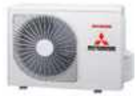
SRC20ZS-W, SRC25ZS-W SRC35ZS-W