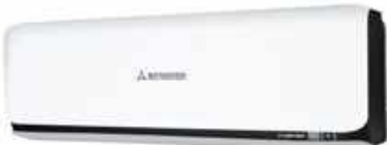
SRK-ZSX-W(B), Contrast zwart-wit