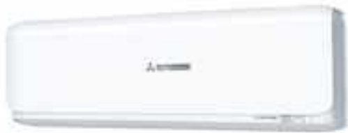
SRK-ZSX-W, Wit RAL9003